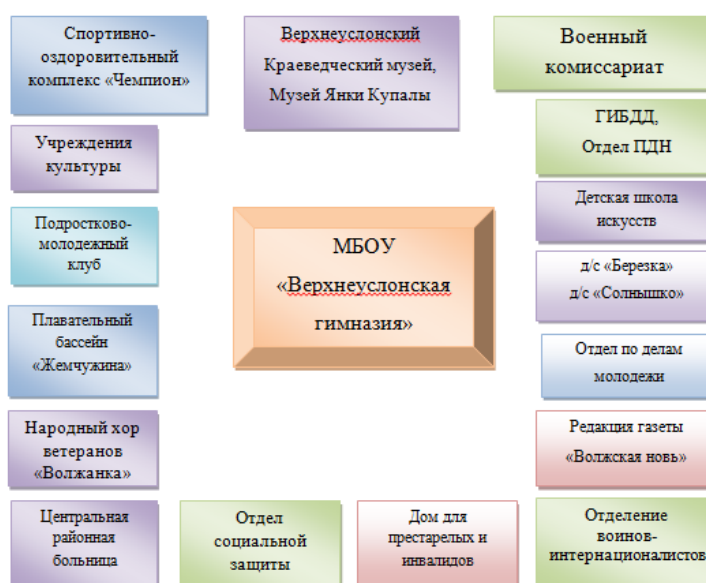
Взаимодействие МБОУ «Верхнеуслонская гимназия» с социумом

Парадигма взаимовыгодного партнерства предусматривает признание неполного совпадения взглядов и интересов участников отношений, более того, наличие взаимоисключающих интересов; в то же время допускается возможность нахождения отдельных ситуаций, когда цели участников близки или может быть достигнут временный компромисс. В этом случае в достигаются договоренности, разрабатываются и реализуются отдельные социальные проекты. Технология социального проектирования призвана обеспечить эффективность расходования ресурсов всеми партнерами, так как каждый ориентирован на наиболее полную реализацию своих интересов. Так складывается взаимодействие между педагогическими работниками и семьями и другими организациями.